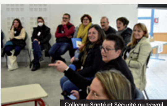
Colloque Santé et Sécurité au travail