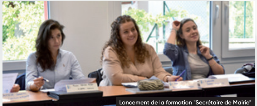
Lancement de la formation "Secrétaire de Mairie"