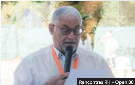
Rencontres RH - Open 88