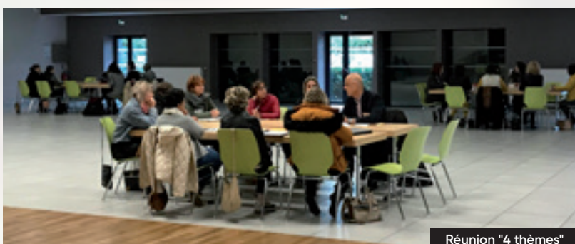
Réunion "4 thèmes"