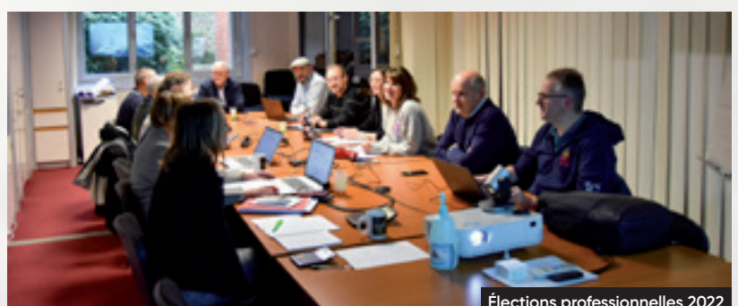
Élections professionnelles 2022