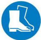
Chaussures de sécurité