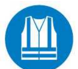
Vêtement haute visibilité