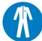
Tenue de travail